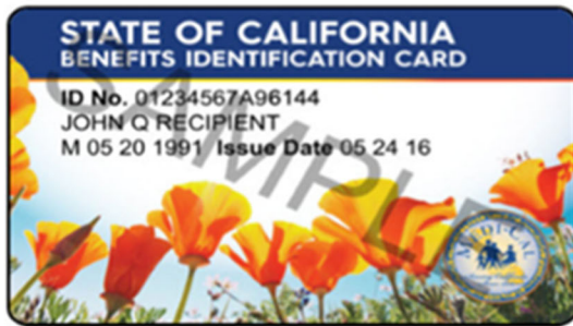
BIC Poppy Design